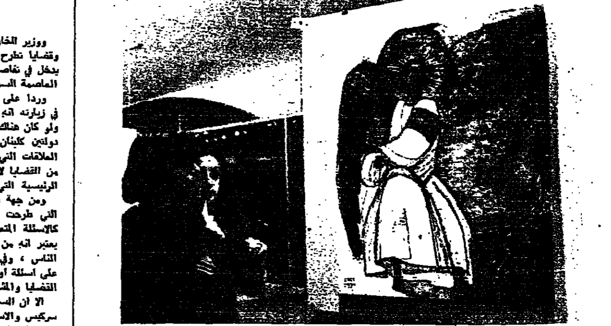
لوحة «أجحة السلام» لاسي سركس

وزير الخارجية السيد نواد برطس، تصبوا منه ما قد يتسجد من مواضع... لقاء سركيس والاسد - تتمة